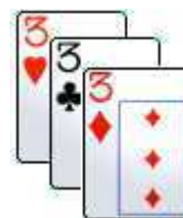
Tris Di 3

BALANZONE VIAGGI Via Protti 2e 40139 – Bologna Tel. 051.541536 – Fax 051.545179 info@balanzoneviaggi.it